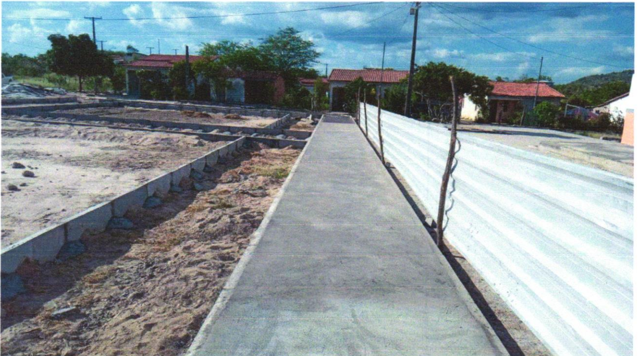
Foto 04 - TAPUME COM TELHA METÁLICA. AF_05/2018