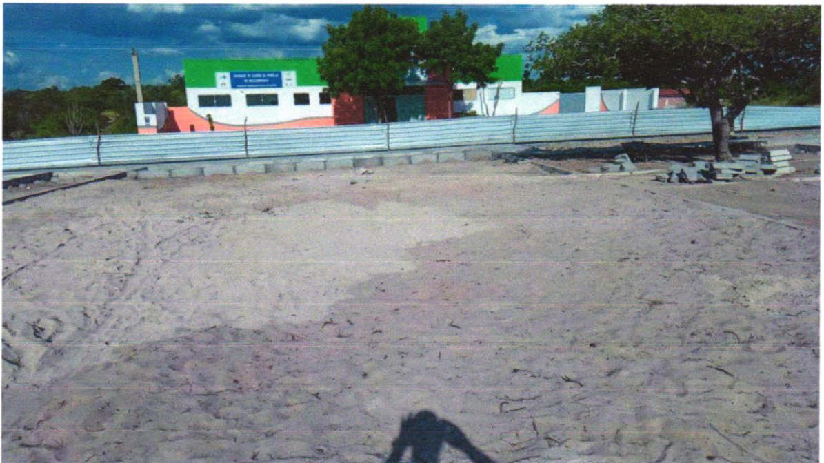
Foto 06 - ATERRO MANUAL DE VALAS COM AREIA PARA ATERRO E COMPACTAÇÃO MECANIZADA. AF_05/2016