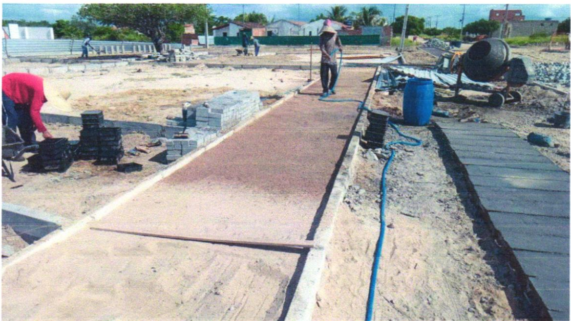
Foto 08 - REGULARIZAÇÃO E COMPACTAÇÃO DE SUBLEITO DE SOLO PREDOMINANTEMENTE ARENOSO. AF_11/2019