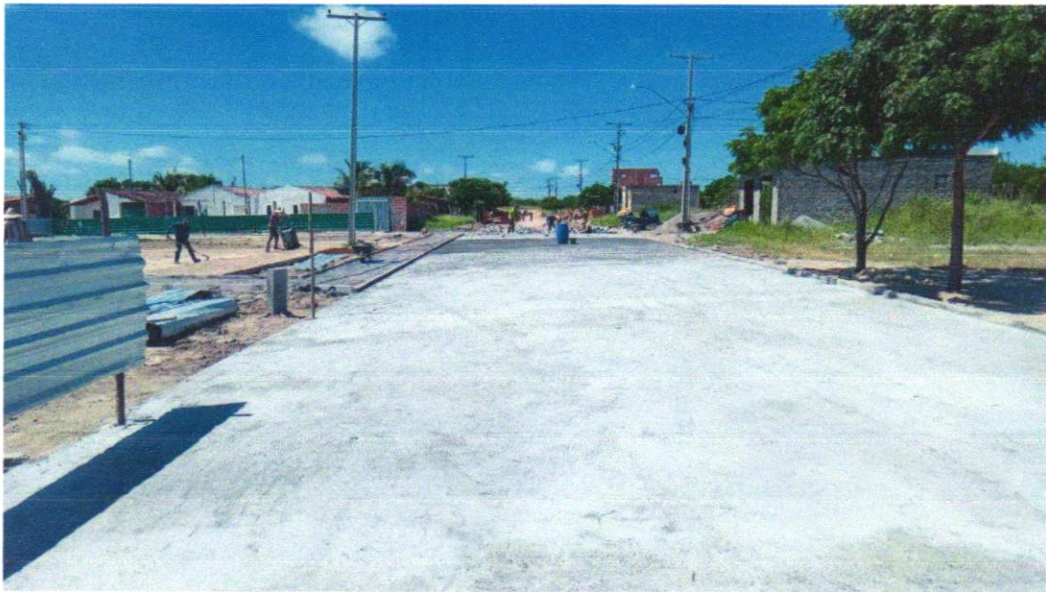
Foto 12 - EXECUÇÃO DE PAVIMENTO EM PARALELEPÍPEDOS, REJUNTAMENTO COM ARGAMASSA TRAÇO 1:3 (CIMENTO E AREIA). AF_05/2020