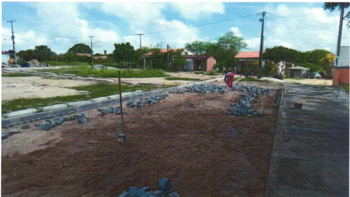
Foto 10 - EXECUÇÃO DE PAVIMENTO EM PARALELEPÍPEDOS, REJUNTAMENTO COM ARGAMASSA TRAÇO 1:3 (CIMENTO E AREIA). AF_05/2020